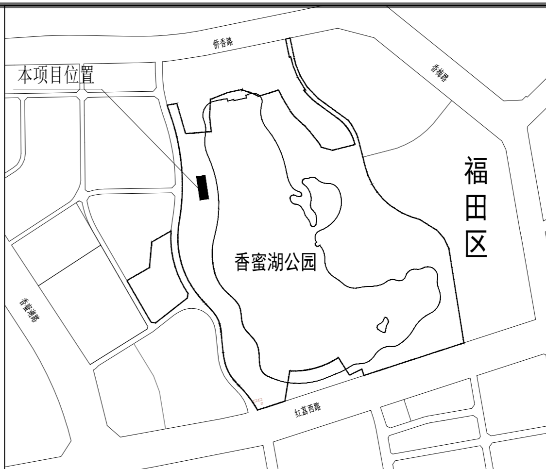
花境咖啡厅主要技术经济指标表