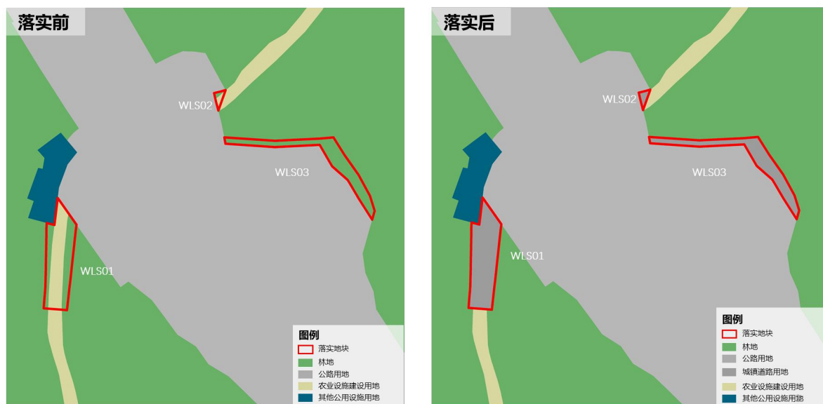
图2 《深圳市大鹏新区国土空间分区规划(2021-2035年)》规划用地用海图 (局部一: WLS01-WLS03)