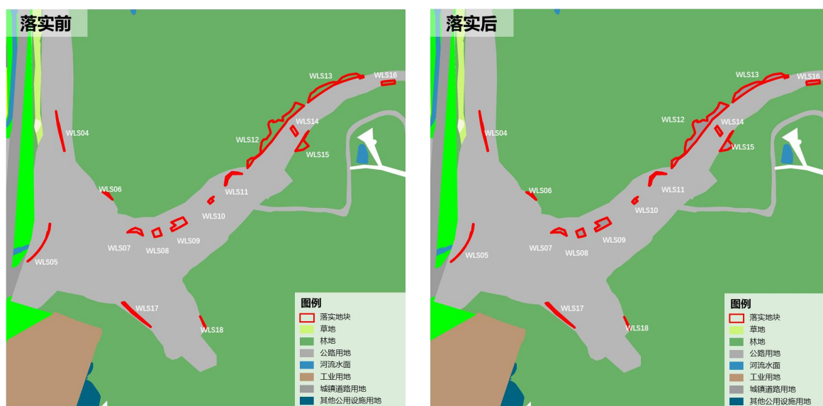
图3 《深圳市大鹏新区国土空间分区规划(2021-2035年)》规划用地用海图 (局部二: : WLS04-WLS18)