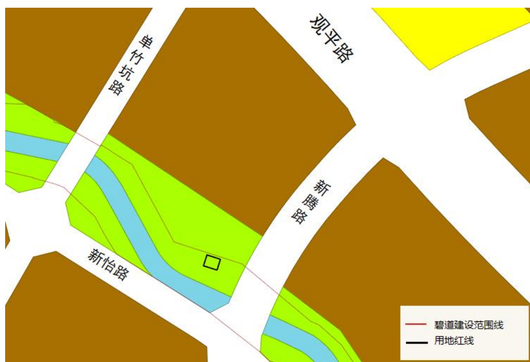
樟坑径河碧道-碧水清驿用地指引图