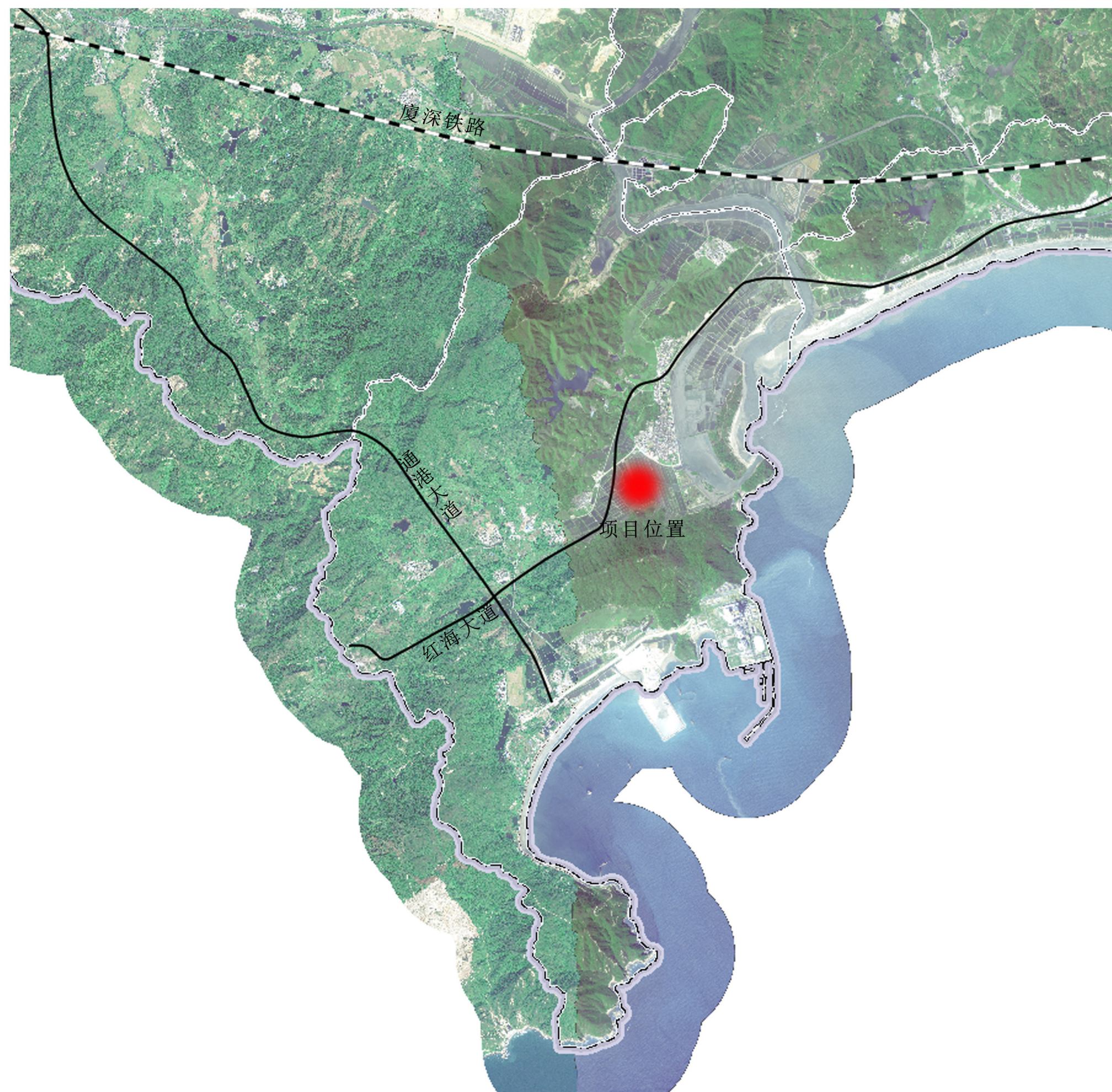
项目在小漠镇的位置图