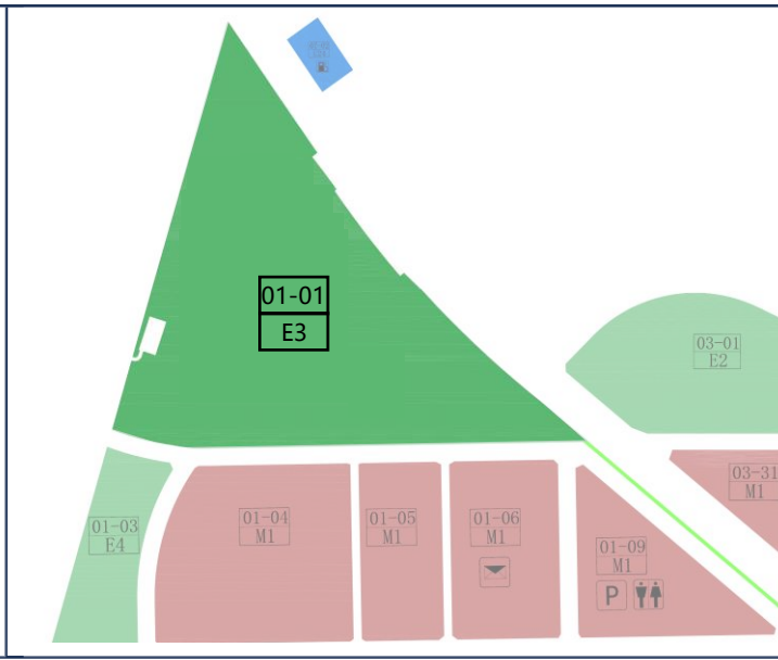
地块控制指标一览表 (调整前)