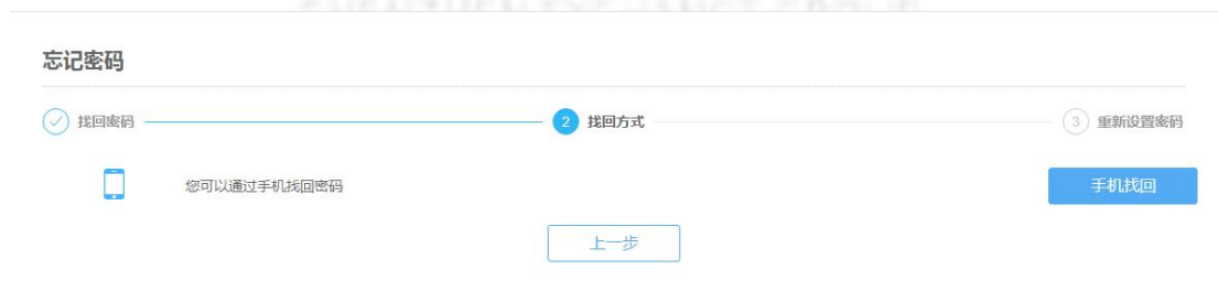
图 13 自然人登录找回方式

点击“手机找回”，进入“自然人登录重新设置密码”界面，输入手机验证码、新密码、再次输入，点击“确定”即可完成重置密码。