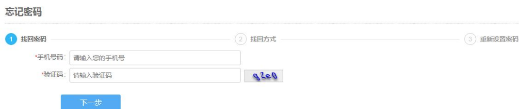
图 12 自然人登录找回密码

如果忘记自然人登录密码（即实名注册密码），可点击图 11 “自然人登录”界面中的“忘记密码”功能，进入“自然人登录找回密码”界面。