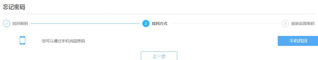
图 9 企业登录找回方式

输入统一社会信用代码或纳税人识别号、图片验证码，点击“下一步”，进入“企业登录找回方式”界面。