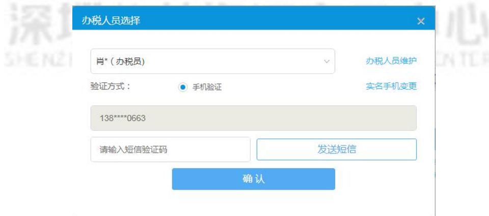
图 8 办税人员选择

在“办税人员选择”界面，选择您的办税身份，点击“发送短信”，输入收到的短信验证码，点击“确认”，进入电子税务局。