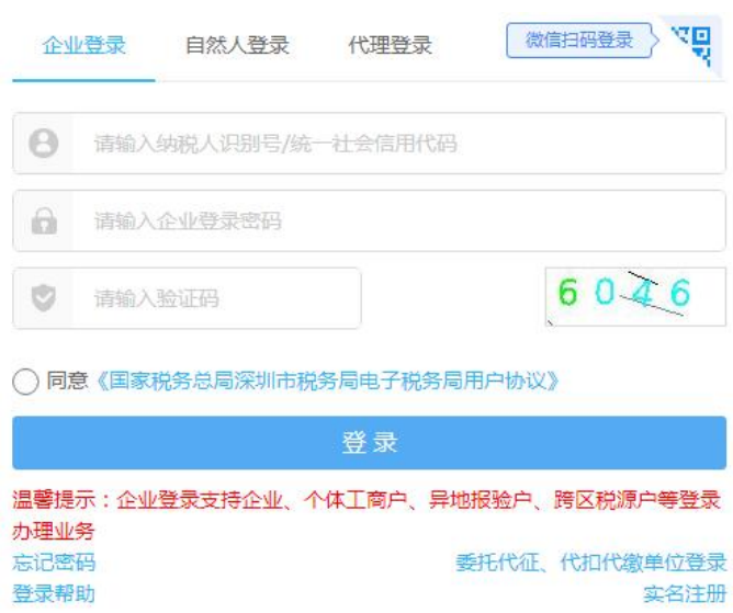
图 7 企业登录

在“办税人员选择”界面，选择您的办税身份，点击“发送短信”，输入收到的短信验证码，点击“确认”，进入电子税务局。