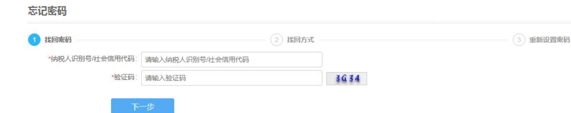
图 8 企业登录找回密码

输入统一社会信用代码或纳税人识别号、图片验证码，点击“下一步”，进入“企业登录找回方式”界面。