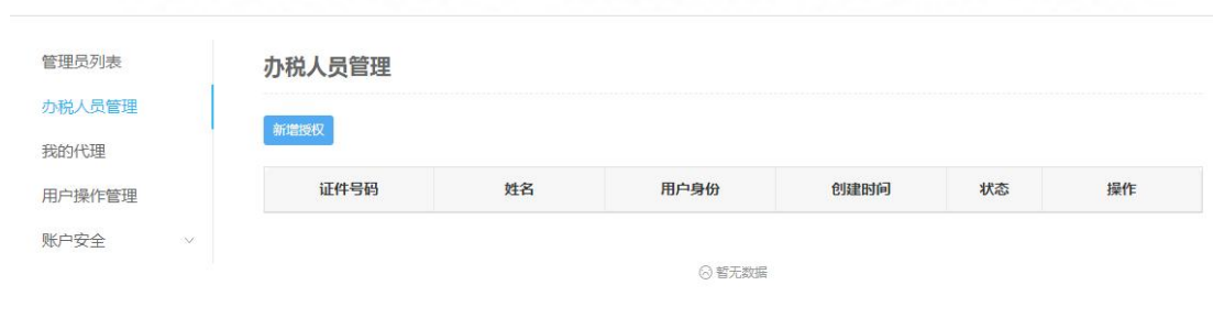
图 4 办税人员管理