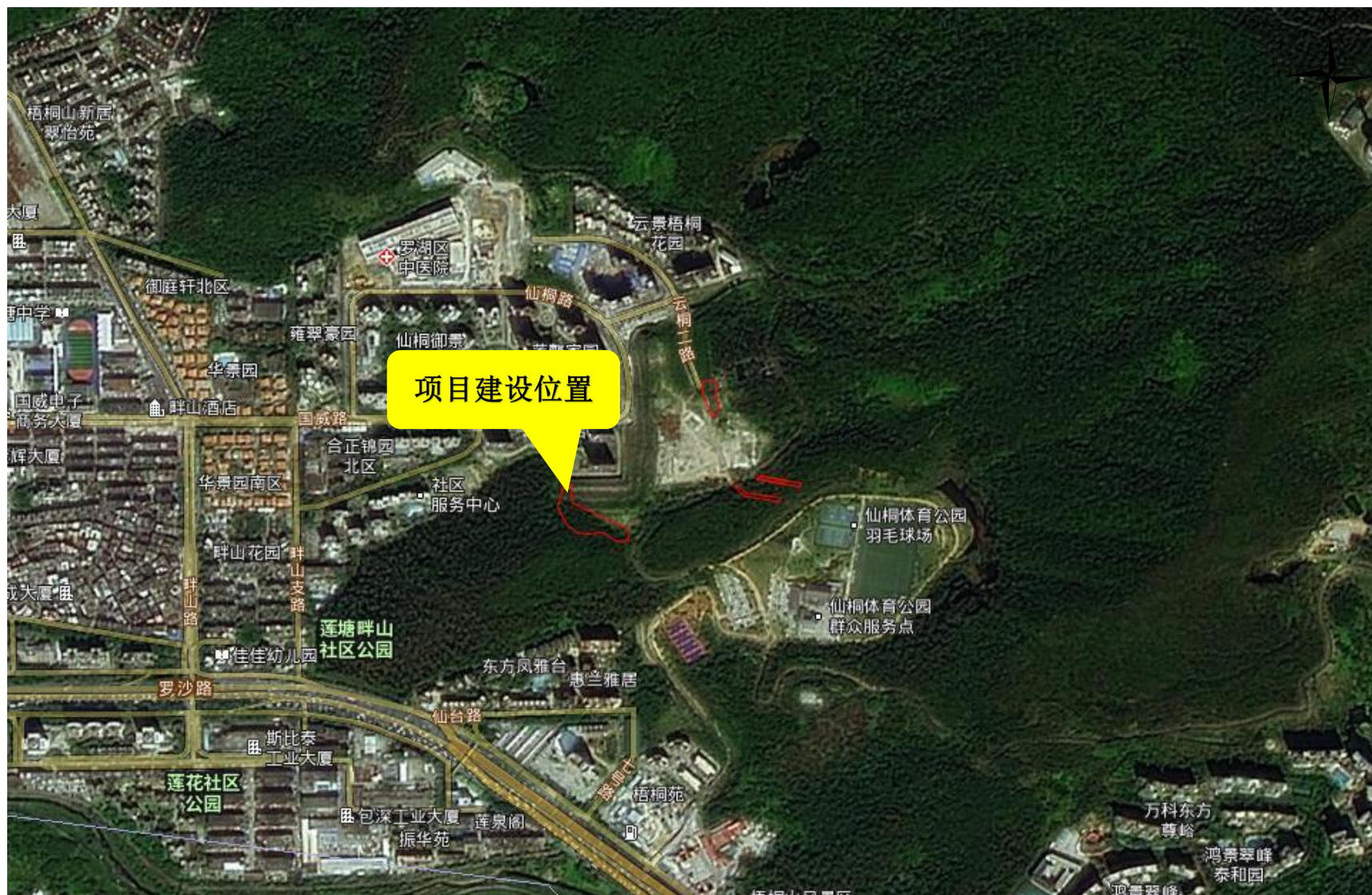
罗湖外国语学校全寄宿制高中新建工程（边坡工程）地理位置示意图