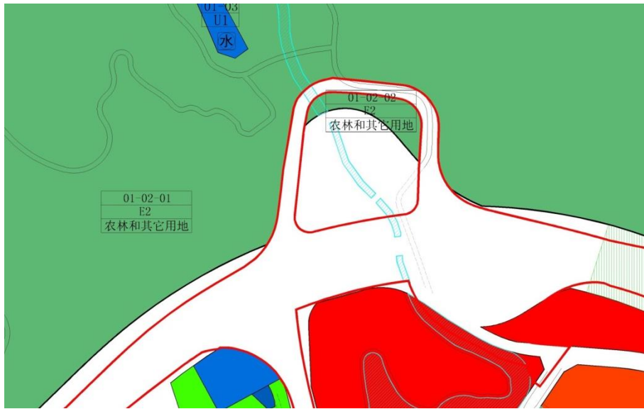
地块控制指标一览表