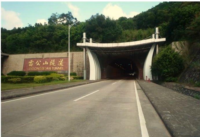
以自然地理实体命名：雷公山隧道